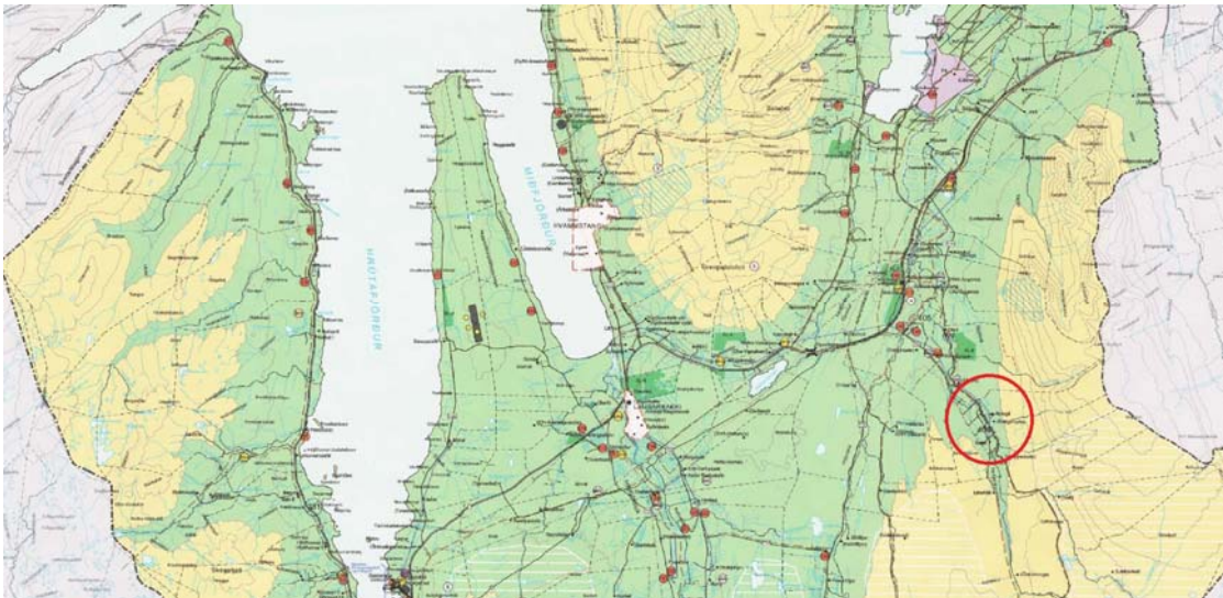
Mynd 2. Hluti sveitaruppdráttar og landnotkun, úr gildandi Aðalskipulagi Húnaþings vestra 2014-2026 (Landmótun 2014).