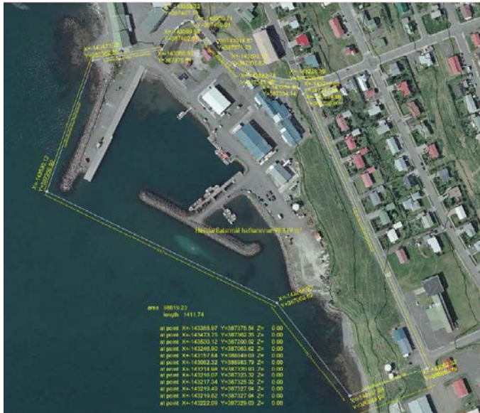
Afmörkun skv. hafnarreglugerð

Hafnarsvæðið er afmarkað skv. afmörkun Hafnarreglugerðar fyrir Hvammstangahöfn (nr. 283/2013). Innan svæðisins rúmast þjónusta sem sinnir þeirri umferð sem fer um svæðið. Innan svæðisins eru leyfð önnur landnotkun í hlutföllunum 30/70.