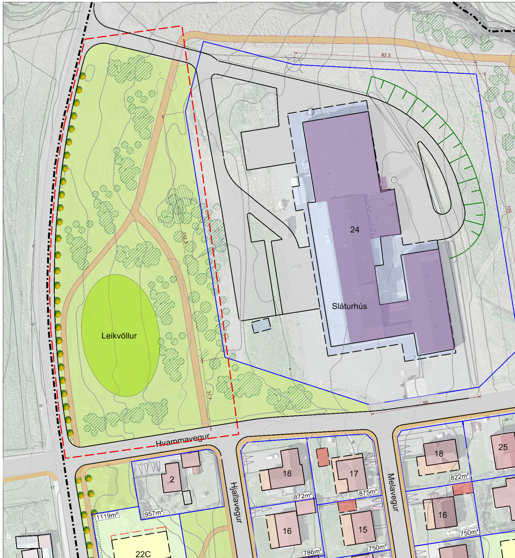
Deiliskipulag Austan Norðurbrautar, samþykkt 12.04.2012 með síðari breytingum samþykktum 31.3.2015.