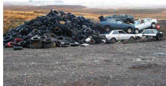
Söfnun hjólbarða og úr sér genginna ökutækja í Grænulaut.

Húnaþing vestra hefur undanfarin ár sent frá sér þá hjólbarða sem safnast hafa saman í sveitarfélaginu.