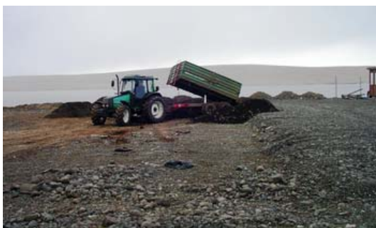
Geymslusvæðið í Grænulaut stækkað vorið 2005.

Framtíðarsýn í sorpmálum. Gera má ráð fyrir að um 500 tonn af heimilisúrgangi og um 1.200 tonn af sláturúrgangi verði urðuð í Grænulaut árið 2006 en eftir það fari magn af urðuðum úrgang hægt en örugglega minnkandi ár frá ári vegna aukinnar endurvinnslu á svæðinu. Fleiri gámar undir fernur og pappír hafa verið keyptir og því má búast við að aukning verði á endurvinnslu í þessum málaflokk.