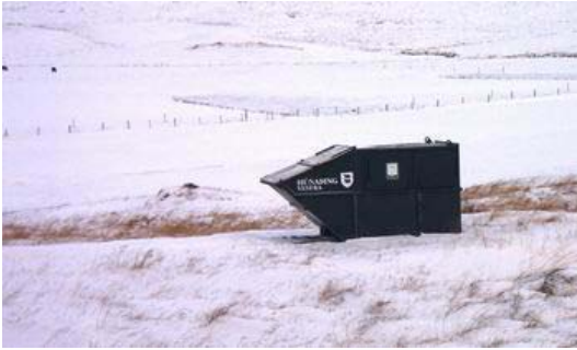
Gámar undir heimilisúrgang í dreifbýli Húnaþings vestra.

Ein leið til útbóta gæti verið að fækka sorphirðudögum og tæma heimilistunnur á tveggja vikna fresti í stað vikulega eins og nú er gert. En þá verða að vera fleiri leiðir opnar til endurvinnslu, s.s. með miðlægri jarðgerð lífræns heimilisúrgangs. Með slíkri breytingu væri hægt að bjóða íbúum upp á lækkun á sorpgjöldum.