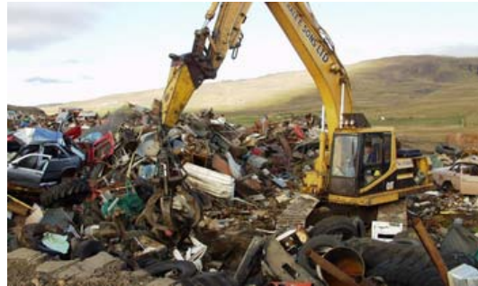
Hreinsun brotamálma við Hvammstanga haustið 2002.

Jafnframt var gerður verksamningur við landeigendur um vöktun, tiltekt og aðstoð við fyrirtæki og almenning á opnunartíma svæðisins. Nafnið Grænalaut er eftir samnefndri laut í landinu.