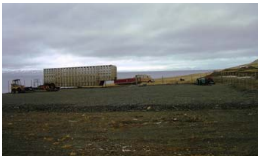
Hluti geymslusvæðisins í Grænulaut tilbúið.

Árin 2004 til 2005 var áfram unnið að stækkun geymslusvæðisins. Stækkunin á þessum árum var upp á um 700 m 2 sem þýddi að um 250 rúmmetrar af mól bættust í planið. Þá var einnig sett upp hluti girðingar umhverfis geymslusvæðið til að verja hagsmuni þeirra aðila sem þar leigja skika.