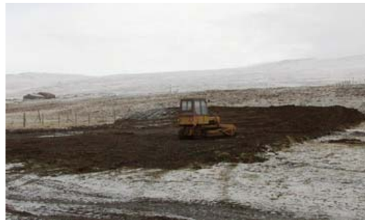
Framkvæmdir við söfnunarsvæðið í Grænalaut hófust í mars 2003.

Fyrripart vetrar 2003 var mikil vinna lögð í að gera söfnunarsvæðið tilbúið undir starfsemina. Jarðýta ýtti jarðveg ofan af gömlum gorgryfjum og mótaði manir til að skýla svæðið fyrir vindum og sjónum vegfarenda. Þá voru 750 tonn af malarefni sett yfir gorgryfjurnar til að gera söfnunarsvæðið, sem er um 2500 m 2 , sem best úr garði.