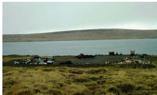
Söfnunarsvæðið í Grænulaut vorið 2005.

Sorphirðuverktaki mun í samstarfi við Húnaþing vestra og Endurvinnsluaðila safna heyrúlluplast a.m.k. tvisvar sinnum árið 2006. Stefnt er að því að fjölga ferðum til að hafa söfnunina jafnari yfir árið.