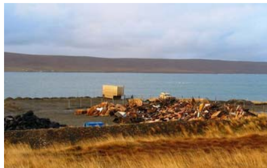
Söfnun hjólbarda og timburs í Grænulaut.

Grunnvatnssýni úr sýnatökuholum við urðunarstaðinn eru tekin með reglubundnum hætti í samráði við eftirlitsaðila til að fylgjast með grunnvatnsrennslinu, þ.e. hvort mengandi efni séu að berast frá urðunarsvæðinu.